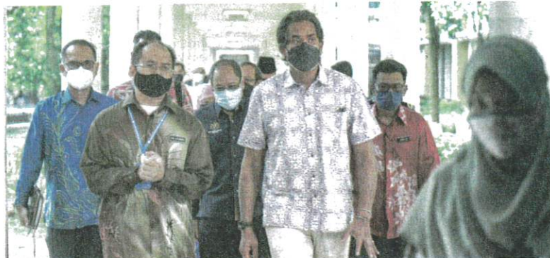
Khairy tiba di Hospital Sultanah Bahiyah, Alor Setar bagi Majlis Penyerahan Sumbangan Peralatan Perubatan Daripada Kerajaan Jepun Melalui Bantuan Geran Jepun Untuk Program Pembangunan Ekonomi dan Sosial 2020 Untuk Malaysia pada Khamis.

Beliau berkata demikian selepas Majlis Penyerahan Sumbangan Peralatan Perubatan Daripada Kerajaan Jepun Melalui Bantuan Geran Jepun Untuk Program Pembangunan Ekonomi dan Sosial 2020 Untuk Malaysia.